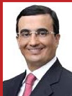
BENJAMIN MARANHÃO (SOLIDARIEDADE)